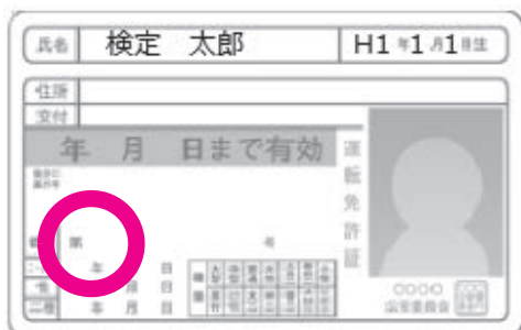
○氏名と生年月日がすべて写っている