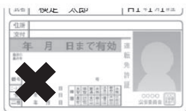
×氏名と生年月日が切れている